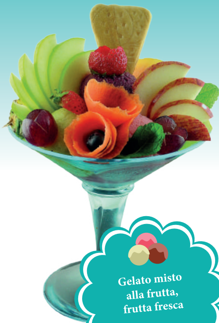
Gelato misto alla frutta, frutta fresca € 9,50 TUTTI I FRUTTI 3