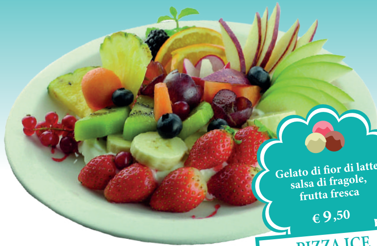
Gelato di fior di latte, salsa di fragole, frutta fresca € 9,50 PIZZA ICE 3