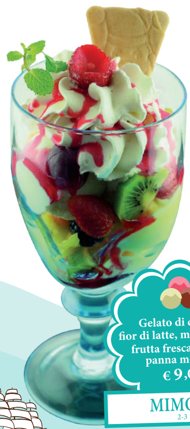
Gelato di crema e fior di latte, macedonia di frutta fresca, fragole, panna montata € 9,00 MIMOSA 2-3