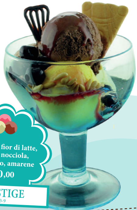
Gelato di fior di latte, crema, nocciola, cioccolato, amarene € 10,00 PRESTIGE 2-3-9